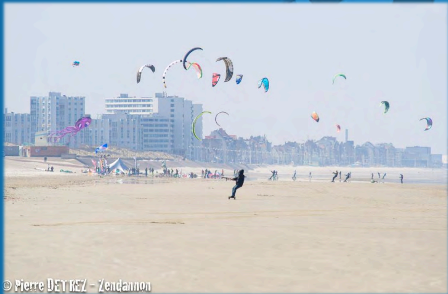
© Pierre DEY REZ - Zendannon