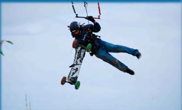
© Pierre DEY REZ - Zendannon