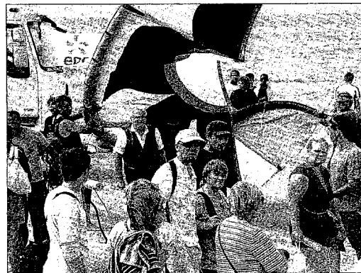
Hier, le village des championnats du Monde de kitesurf faisait partie de la balade des estivants.

semble pour une épreuve d'endurance. Tertio, le kitemloop contest. Les engagés doivent effectuer le maximum de rotation dans les airs pour s'imposer. ■ Pour le grand public Les spectateurs pourront se procurer la brochure de présentation, munie d'un lexique vulgarisant les figures. Christophe Tasti, micro en main, se chargera d'éclairer le spectacle. Ce speaker a été le premier champion du Monde de kitesurf. Côté animation : tyrolienne géante, mur d'escalade, wake box, surf rodéo gonflable, baptêmes de cerf-volant de traction sont prévus sur le site. ■