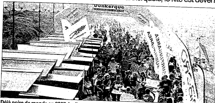
Déjà noire de monde en 2007, la digue sera encore prise d'assaut à l'occasion de ces championnats du monde.

Le kite, c'est génial. A la mode, la planche tracée par une grand voile risque de faire rêver pas mal de chérubins accrochés aux basques des parents cette semaine. Papa, maman si vous lisez ces lignes, un conseil : ne vous jetez pas trop vite dans une réponse du style, « oui; nous irons voir demain pour t'acheter ta planche... », vous risqueriez de boire la tasse au moment de payer l'addition. Car le kite à Dunkerque n'a pour le moment pas dépassé le seul cadre du plan com'. Et c'est bien dommage... Un matériel de kite aujourd'hui coûte un petit millier d'euros. Pas donné. L'idéal voudrait alors que le chaland puisse éventuellement goûter à la discipline en passant sur les bancs d'un club. Seulement, dans ces structures privées ou associatives, impossible de