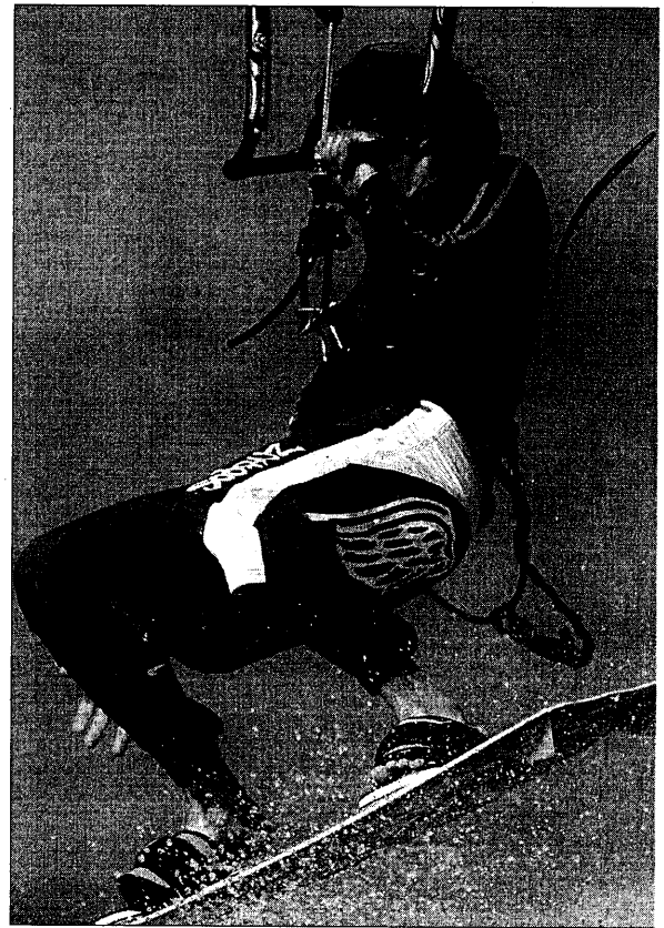
Le kitesurfer est dans l'air comme un poisson dans l'eau.

En avril dernier, nos quatre profs ont rencontré leurs collègues de toute la France (notamment des Bretons), pour réfléchir à la pratique scolaire de leur sport favori. L'enjeu ? L'exemple de l'académie de Bordeaux, où le surf est pour la première fois cette année une épreuve facultative au baccalauréat, pourrait faire école. Pourquoi pas choisir le kitesurf pour attrapper au vol quelques points supplémentaires ? « On y pense pour 2009... » En attendant, la compétition d'aujourd'hui pourrait bien être une sorte de bac blanc : elle est préparatoire à la première coupe de France scolaire de kitesurf, qui, prévue en 2008, pourrait bien se tenir... à Dunkerque ! ► Le vent devrait être de la partie pour la compétition, de 9 h à 17 h, plage de la Licorne (Malo-Lefrinckoucke). Le site du Kud : http://kud.neuf.fr/